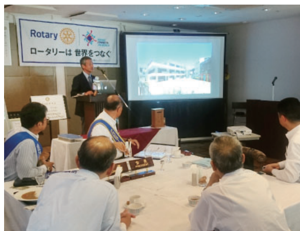
ドローンで撮影した映像を投影していただきました

第 2027 回例会 2019. 8.22 晴 司会 遠田会員 ロータリーソング 「それでこそロータリー」